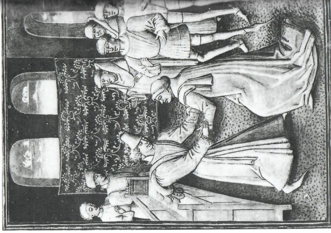
Graaf Willem III speelde een centrale rol op het Europese politieke toneel. Dit maakte zijn dochters tot gewilde bruiden. Hier is afgebeeld hoe Engelse gezanten komen vragen om de hand van Philippa als bruid voor koning Edward III. Miniatuur in de Bresslauer Froissart.

In Holland en Zeeland merkten de onderdanen niet veel van hun graaf. Toch daalde er een zekere rust over de gewesten na de woelingen van de laatste jaren van Floris V en de beide Jannen. Maar waar de mensen hun conflicten bijlegden, woedde de natuur. In de jaren 1315-16 teisterden slagregens en misoogsten het land en maakte een epidemie talloze slachtoffers onder de bevolking en onder de veestapel. Daarna volgden echter jaren van herstel, waarin de graafschappen Holland en Zeeland opnieuw gestalte kregen. Door het ontstaan van een dicht net van stedelijke en regionale markten ontstond een levendige markteconomie, waar heel het graafschap baat bij had.