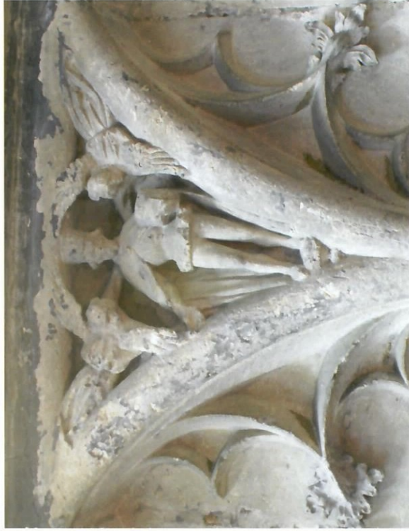
De Onze Lieve Vrouwekerk van Halle, ten zuiden van Brussel, had een bijzondere band met het geslacht der Avesnes. Toen in het midden van de veertiende eeuw een nieuw kerkgebouw verrees, kreeg graaf Willem 'de Goede' een bescheiden ereplaatsje als gebeeldhouwde figuur in een zwikvulling van een zijkapel. (OLV kerk, Halle)

Henegouwse dichter Jean de Condé kort na Willems overlijden maakte voor de hoin conte Willaume . Zeker in Valenciennes, waar hij begraven werd, gedacht men hem als zodanig. Ook in de ereredes van Duitse en Nederlandse herauten, waaronder de beroemde heraut Gelre, klinkt de waardering voor de graaf door. Johannes de Beke besloot zijn beschrijving van Willems bevind eveneens met een lofrede op het eerlijke bestuur dat 33 jaar had geduurd. En hij besloot: Dese prince was zeghelic in stride, gheprijs in tornoye, vrome in tafelronde ende sundertinghe ghesellic in gheselscape . Deze waardering lijkt vooral ingegeven door de kwaliteiten van de vorst, maar is voor een deel te verklaren vanuit de onrust waarin zijn graafschappen verzeild raakten onder zijn zoon en opvolger Willem IV. Die had wel de moed, maar niet de tact van zijn vader geërfd. En wat dat betekende, zou men spoedig merken.