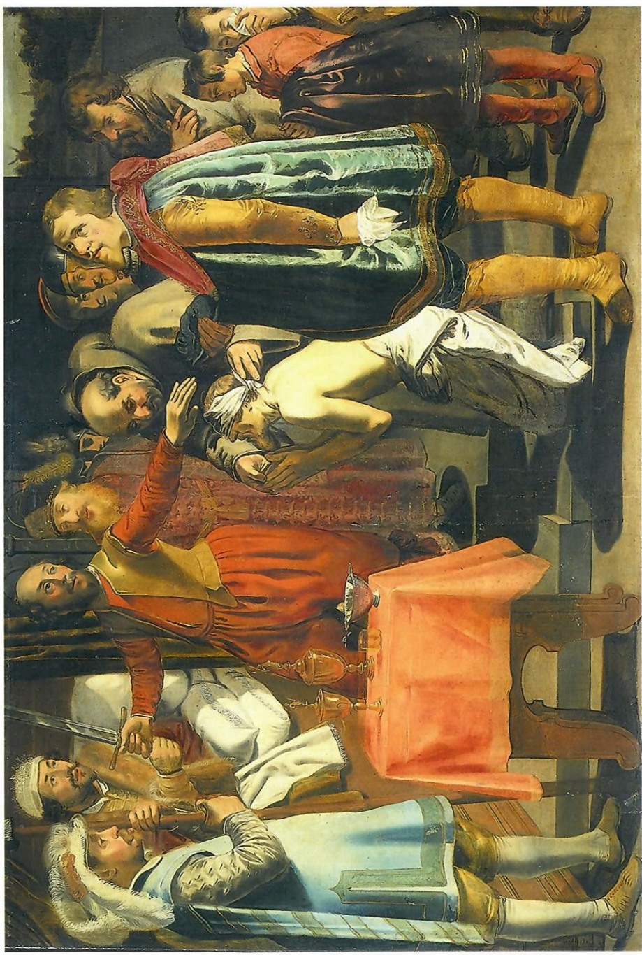
Willem III en de kwade baljuw. De spreekwoordelijke rechtvaardigheid van Willem III was een geliefkoosd thema, dat vooral populair werd door het verhaal van zijn bestraffing van een corrupte baljuw van Zuidholland en diens rol bij de diefstal van een koe. Vanaf zijn ziekbed gaf de graaf bevel de baljuw te onthoofden. Schilderij eerste helft 17 de eeuw, kopie naar Simon Hendrixz. (Rijksmuseum, Amsterdam).