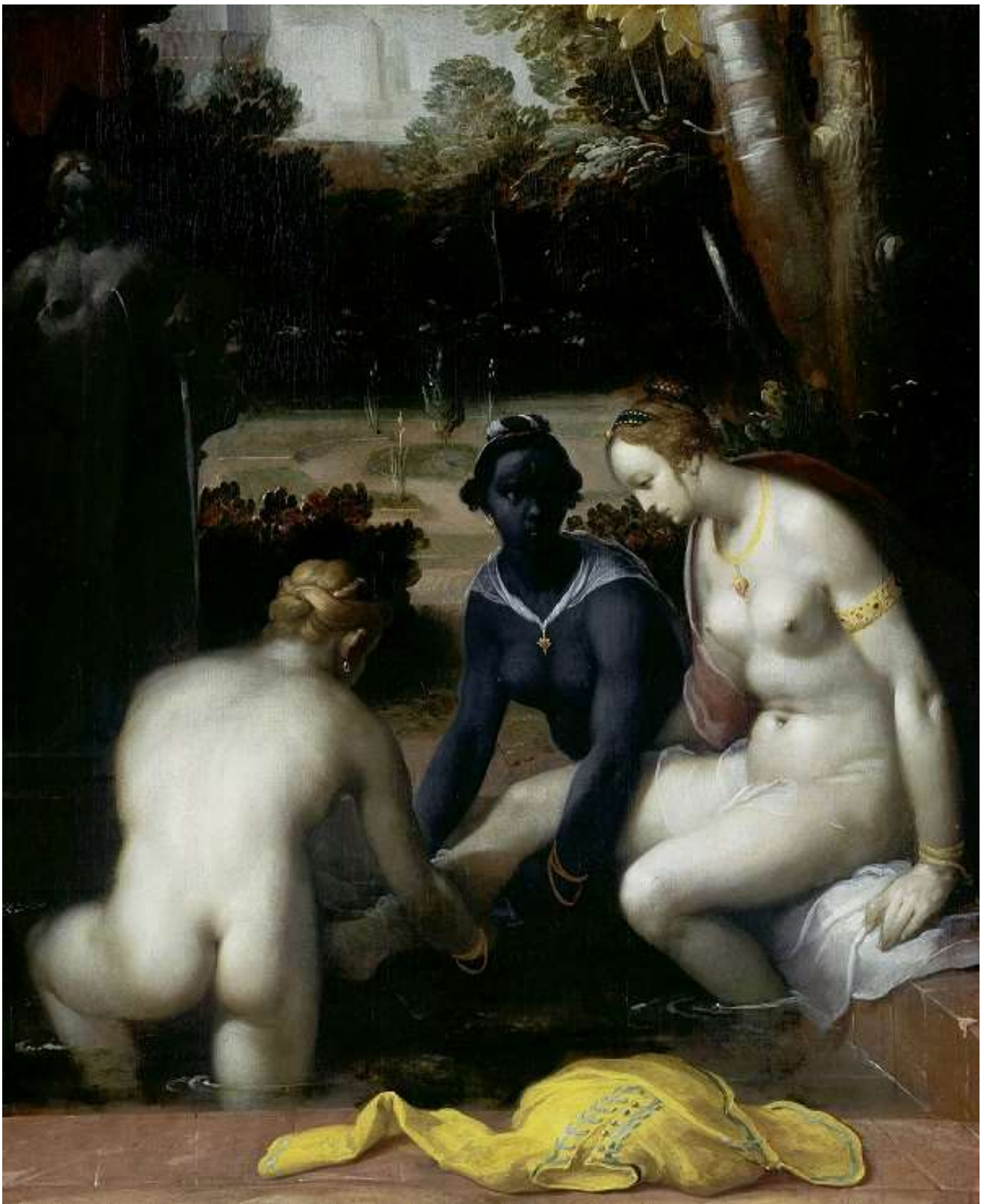
De mooie Bathseba neemt een bad in de open lucht. Twee dienaressen helpen haar hierbij. Koning David ziet de jonge vrouw vanaf het dak van zijn paleis en wordt op slag verliefd. Hij is niet afgebeeld maar zijn aanwezigheid wordt gesuggereerd door het kasteel op de achtergrond. Cornelis Cornelisz. van Haarlem, Het toilet van Bathseba (1594).