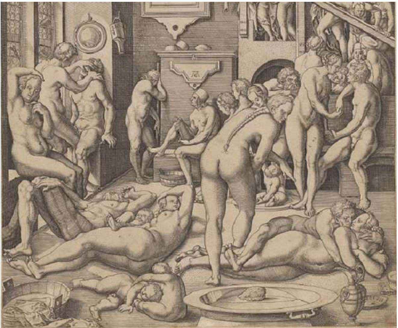
Badhuis met mannen en vrouwen, Virgilius Solis, naar Heinrich Aldegrever, 1524-1562.