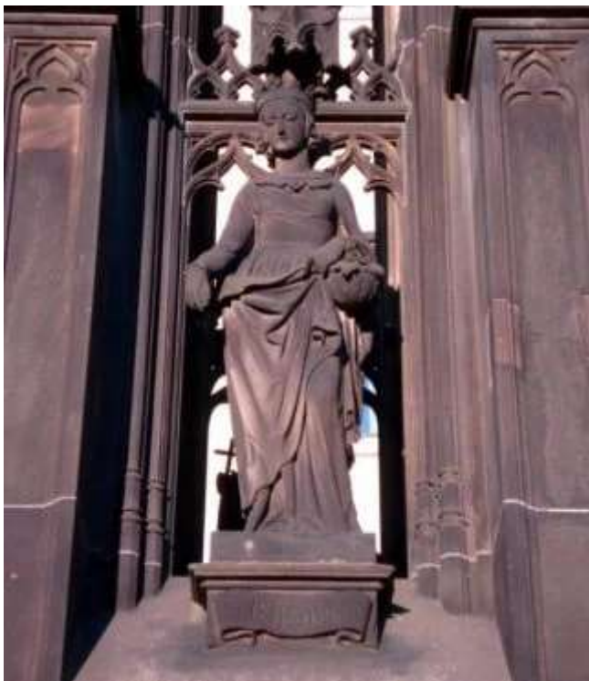
Beeld van Elisabeth van Thüringen in Dresden

onder te lijden. Het gevolg was dat op sommige plekken in de dagen erna dijken doorbraken en grote overstromingen volgden. Aangezien 19 november vroeger de naamdag van de heilige Elisabeth van Thüringen was, werd de overstroming naar deze heilige vernoemd: Sint-Elisabethsvloed. Tegenwoordig valt de naamdag van de heilige op 17 november.