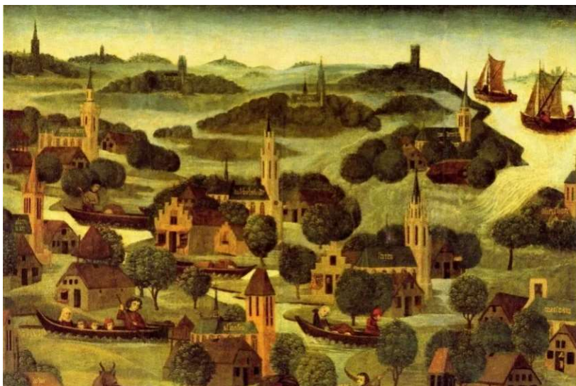
De Sint-Elisabethsvloed van 1421

Henk 't Jong · Laatste update: 21 november 2023 · 3 minuten leestijd