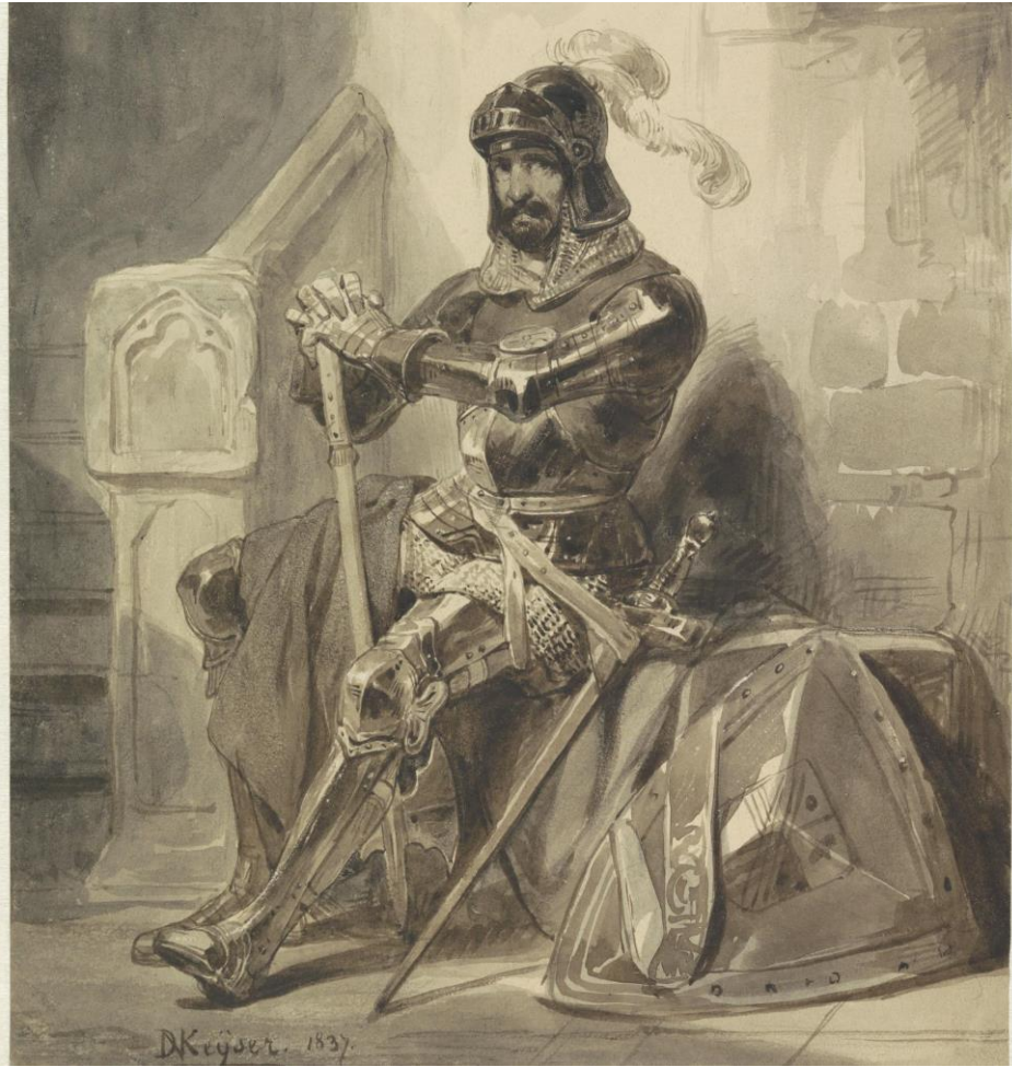
Een Middeleeuwse ridder