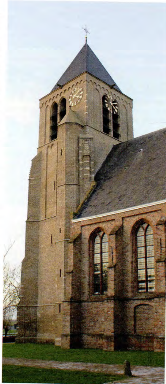
De kerk van Giessen-Oudekerk, uit tweede helft veertiende eeuw, ingrijpend hersteld in 1657, het koor werd in 1838 afgebroken. (van Groningen (1992), p. 151, 153)

Het leenrepertorium van Giessen-Oudekerk begint in 1390 en noemt als heerlijke rechten de smaltienden, tijnsen, excijnsen, visserijen, de molenwerf en enkele uitlanden. Later hoorde Giessen-Oudekerk bij het baljuwschap Zuidholland, zodat het een lage heerlijkheid was. Giessen-Oudekerk vormde tot 1957 een gemeente met Giessendam, maar ging toen op in gemeente Giessenburg, die in 1986 opging in de gemeente Giessenlanden. 1