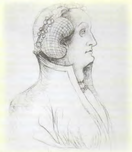
Margaretha van Kleef. (van Rees, p. 64)

Begunstigde, weduwe van hertog Albrecht van Beieren, graaf van Holland, waarmee ze in 1394 was getrouwd, hertogin, ov. Haarlem. In 1408 beleend bij gifte van de graaf. Giessendam was vanwege de hoge kosten van de bedijking niet zo'n begerenswaardig bezit en ook zij wilde er, overmits quader dyckaedzen wille , weer van af. 15 Hoe lang Margaretha vrouwe van Giessendam is geweest, is niet precies bekend en ook niet of haar stiefzoon, Willem V van Beieren, een nieuwe leenman heeft gevonden. In ieder geval volgde Margaretha in 1408 de raad op om Giessendam en de andere 'Giessense' heerlijkheden weer te accepteren. Ze werd toen door haar stiefzoon, de nieuwe graaf van Holland, beleend met