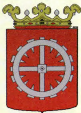
Wapen van Giessendam.

Steunde Willem III bij de belegering van de burcht van Heusden rond 1320, nam in 1337 deel aan een gezantschap naar Engeland, nam in 1345 deel aan de oorlog met de stad Utrecht en sneuvelde in datzelfde jaar in de strijd tegen de Oostfriezen. In 1322 verleende de graaf van Holland een handvest aan het ambacht Oud-Giessen. 7