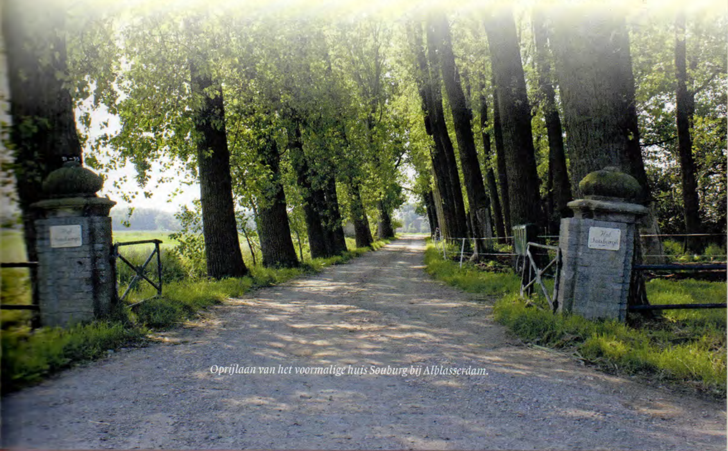
Oprijlaan van het voormalige huis Souburg bij Alblasserdam.