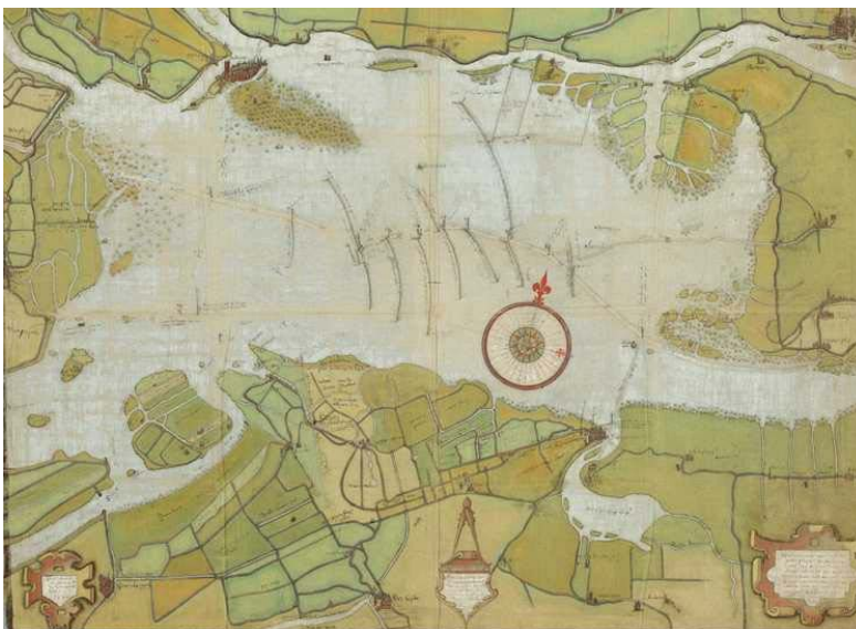
Kaart van de Verdronken Waard uit 1560. Het zuidelijk deel is inmiddels weer drooggelegd. Capelle ligt rechtsonder op de kaart. De vorming van de Biesbosch (linksboven bij Dordrecht) is nog volop bezig.

Na de Sint Elisabethsvloed in 1421 liep de hele Grote Waard onder water.