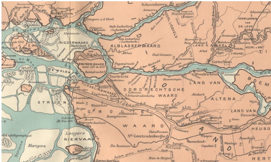
Afbeelding Grote Waard (Wikipedia). Capelle ligt rechtsonder op de kaart.

De ambachtsheerlijkheid (kortweg ambacht) Nederveen lag in de parochie Capelle in de Grote Waard. De Grote Waard werd ontgonnen vanaf 1200, toen de graaf van Holland het in leen kreeg van de hertog van Brabant. In 1287 werd het eigendom van de graaf van Holland. In dat jaar was ook de afdamming van de Middeleeuwse Maas richting de Merwede voltooid. Het dorp Capelle was al eerder gebouwd op hogere grond (samen met het dorp Waspik genoemd in 1257). Het gebied rondom Capelle werd vanaf ca. 1275 ontgonnen.